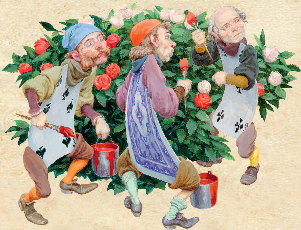
Рисунки Дениса Гордеева