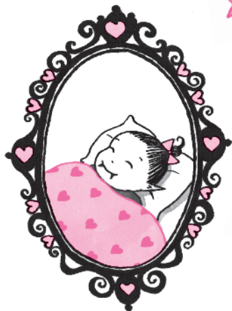
★ Малышка Вишенка ★