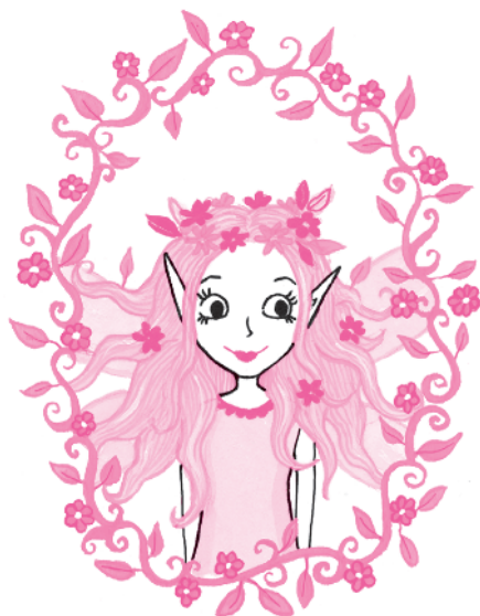
Мама Графиня Корделия Мун