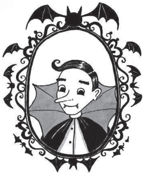
Папа Граф Бартоломью Мун