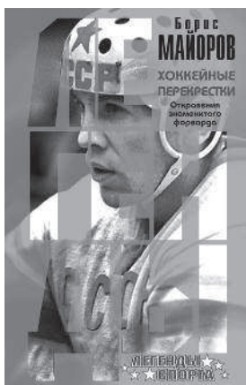
БОРИС МАЙОРОВ ХОККЕЙНЫЕ ПЕРЕКРЕСТКИ