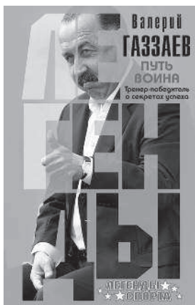
ВАЛЕРИЙ ГАЗЗАЕВ ПУТЬ ВОИНА