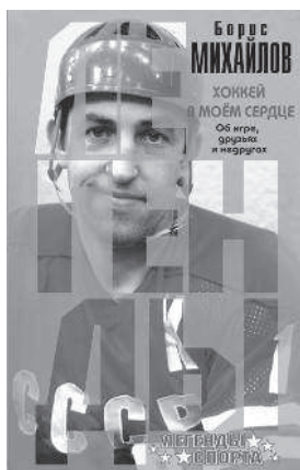
БОРИС МИХАЙЛОВ ХОККЕЙ В МОЁМ СЕРДЦЕ